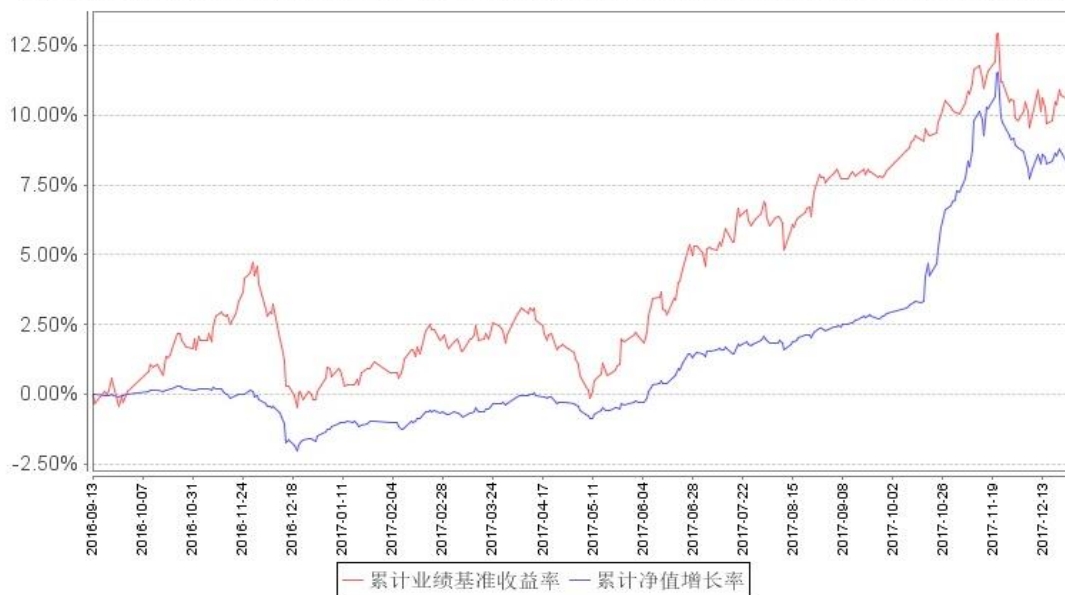
鹏华兴锐定期开放累计净值增长率与同期业绩比较基准收益率的历史走势对比图