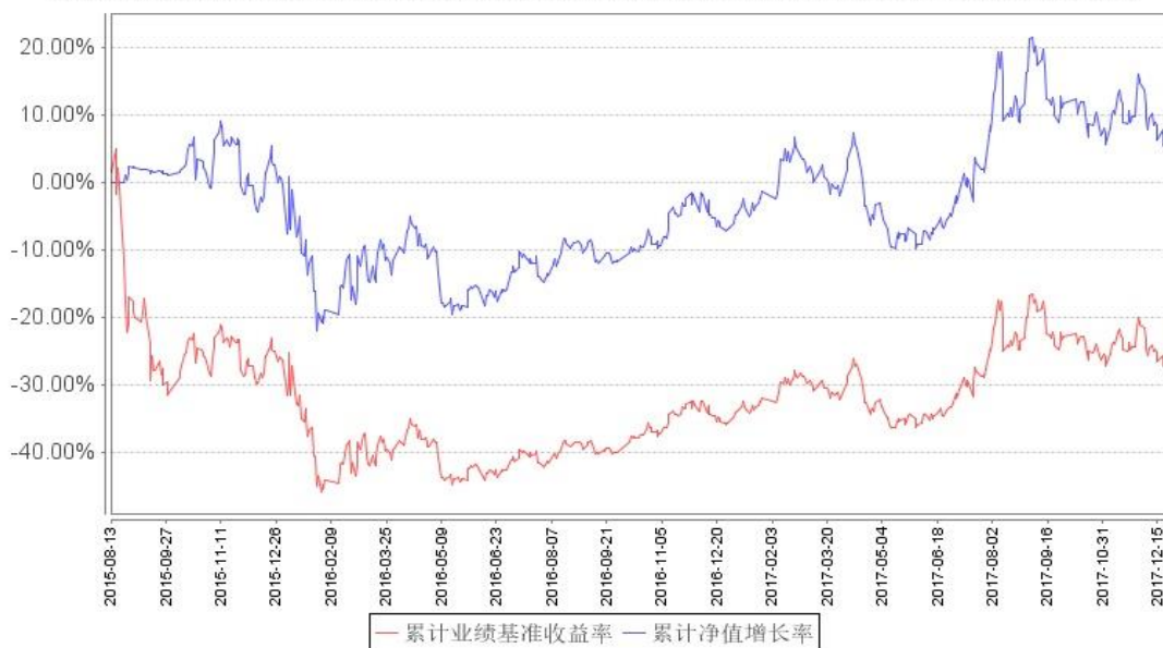
鹏华钢铁分级累计净值增长率与同期业绩比较基准收益率的历史走势对比图