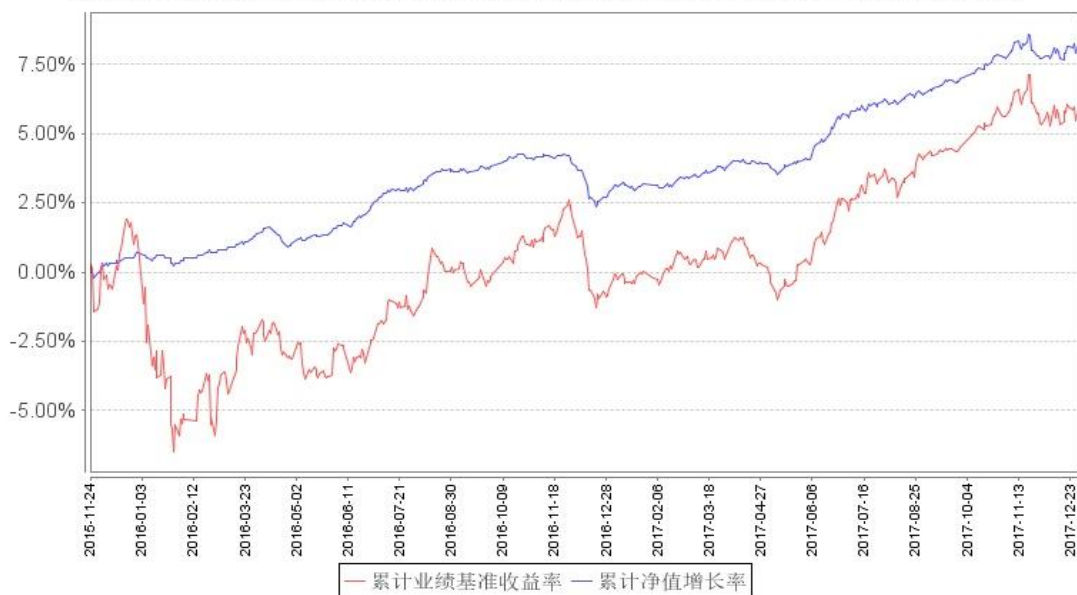
鹏华弘安A累计净值增长率与同期业绩比较基准收益率的历史走势对比图