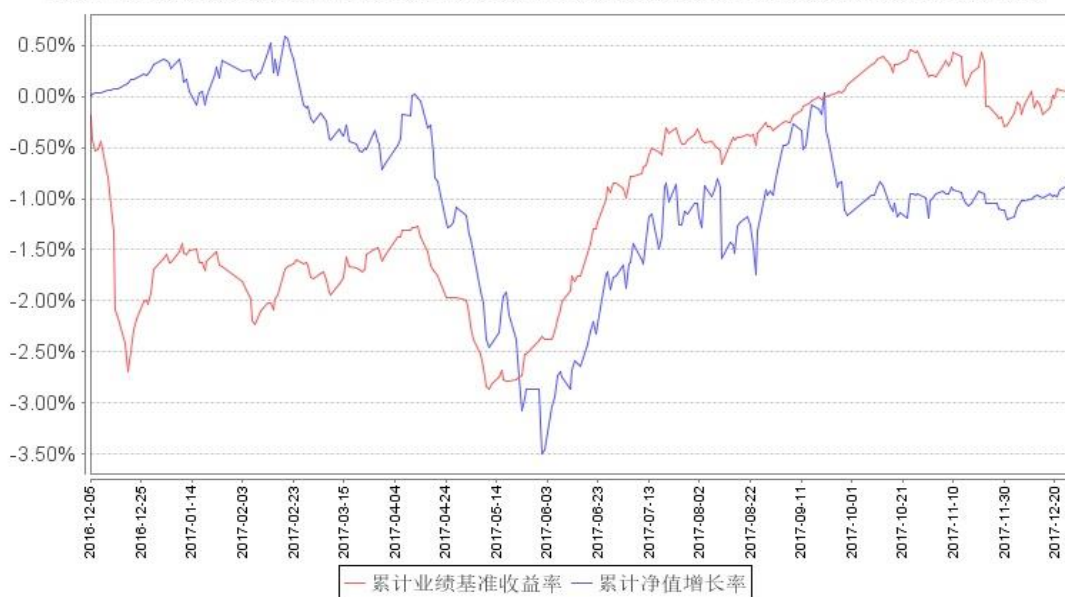
鹏华普泰债券累计净值增长率与同期业绩比较基准收益率的历史走势对比图