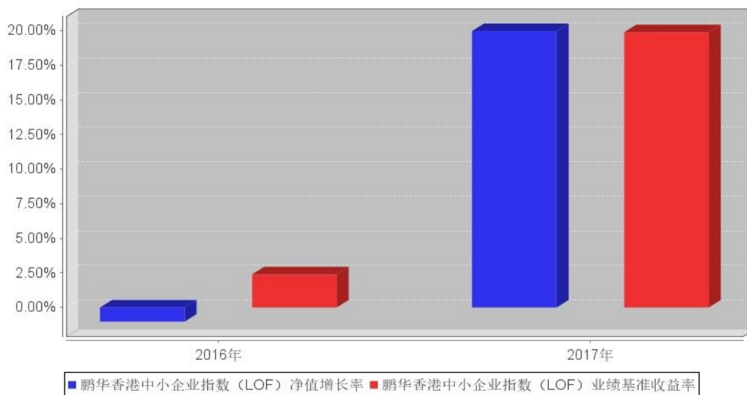
鹏华香港中小企业指数 (LOF) 基金每年净值增长率与同期业绩比较基准收益率的对比图