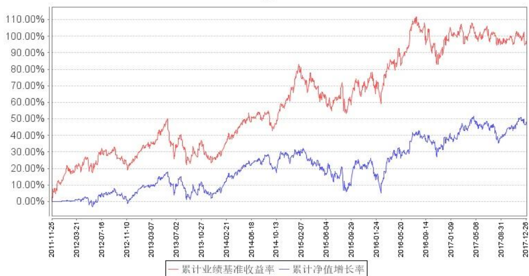
鹏华美国房地产 (QDII) 累计净值增长率与同期业绩比较基准收益率的历史走势对比图