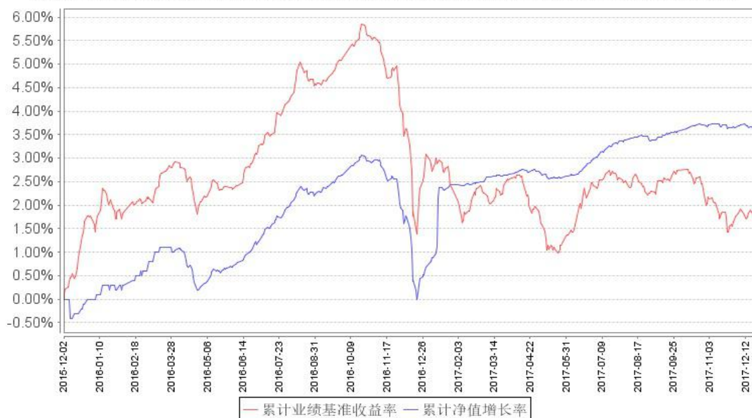
鹏华丰华债券累计净值增长率与同期业绩比较基准收益率的历史走势对比图