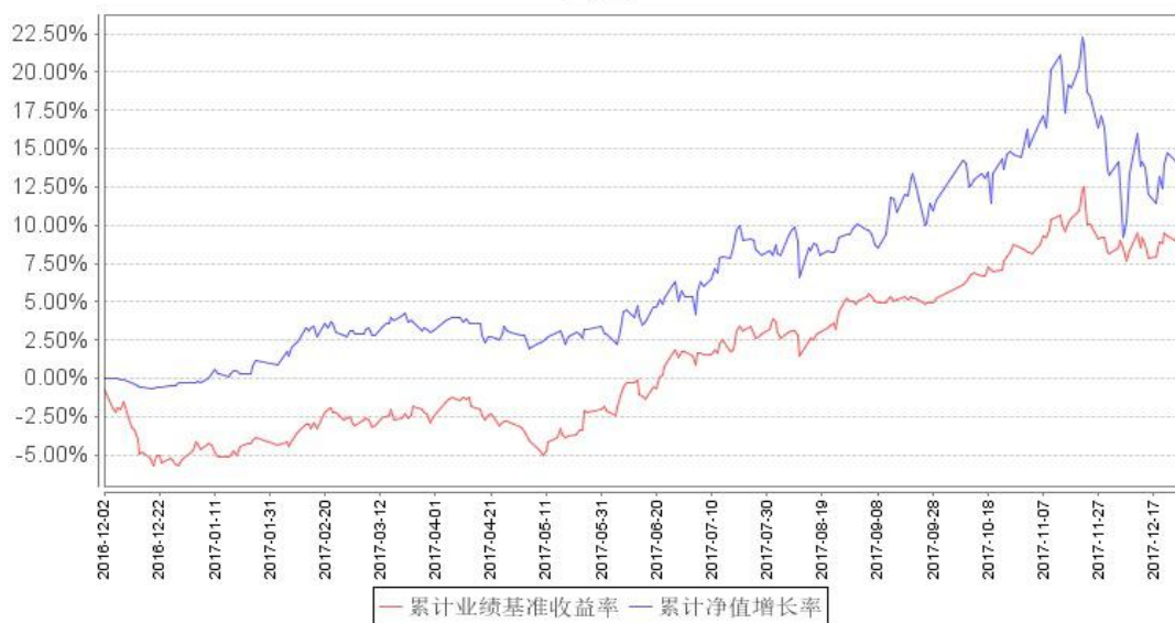
鹏华沪深港新兴成长混合累计净值增长率与同期业绩比较基准收益率的历史走势对比图