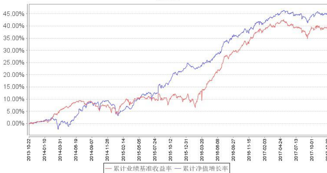
鹏华全球高收益债（QDII）累计净值增长率与同期业绩比较基准收益率的历史走势对比图

注：1、本基金基金合同于 2013 年 10 月 22 日生效，2015 年 9 月 18 日鹏华全球高收益债美元现汇份额成立。