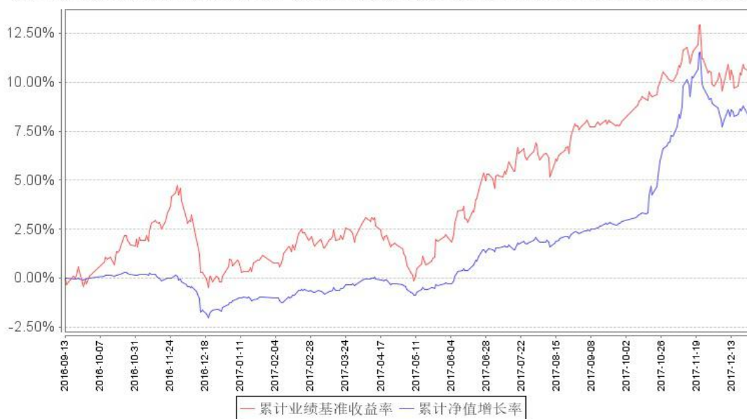
鹏华兴锐定期开放累计净值增长率与同期业绩比较基准收益率的历史走势对比图