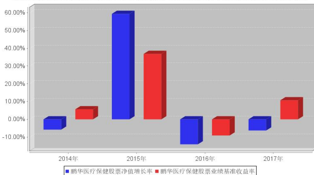
鹏华医疗保健股票基金每年净值增长率与同期业绩比较基准收益率的对比图