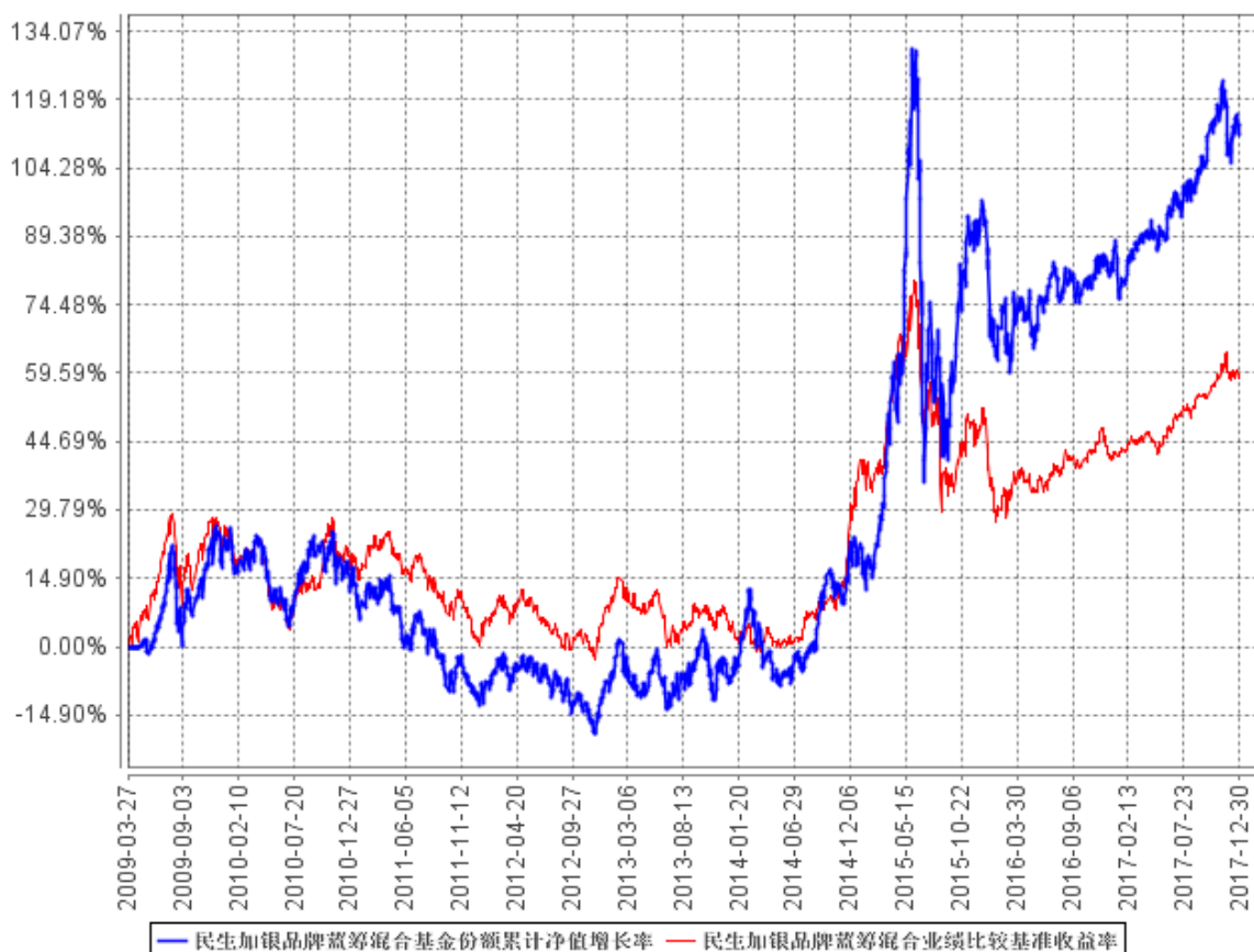
民生加银品牌蓝筹混合基金份额累计净值增长率与同期业绩比较基准收益率的历史走势对比图

注：①本基金合同于 2009 年 3 月 27 日生效。2009 年 4 月 27 日开始办理申购、赎回业务。