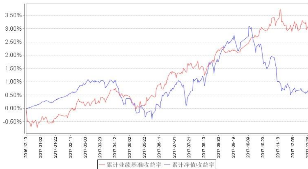
南方安颐养老混合累计净值增长率与同期业绩比较基准收益率的历史走势对比图