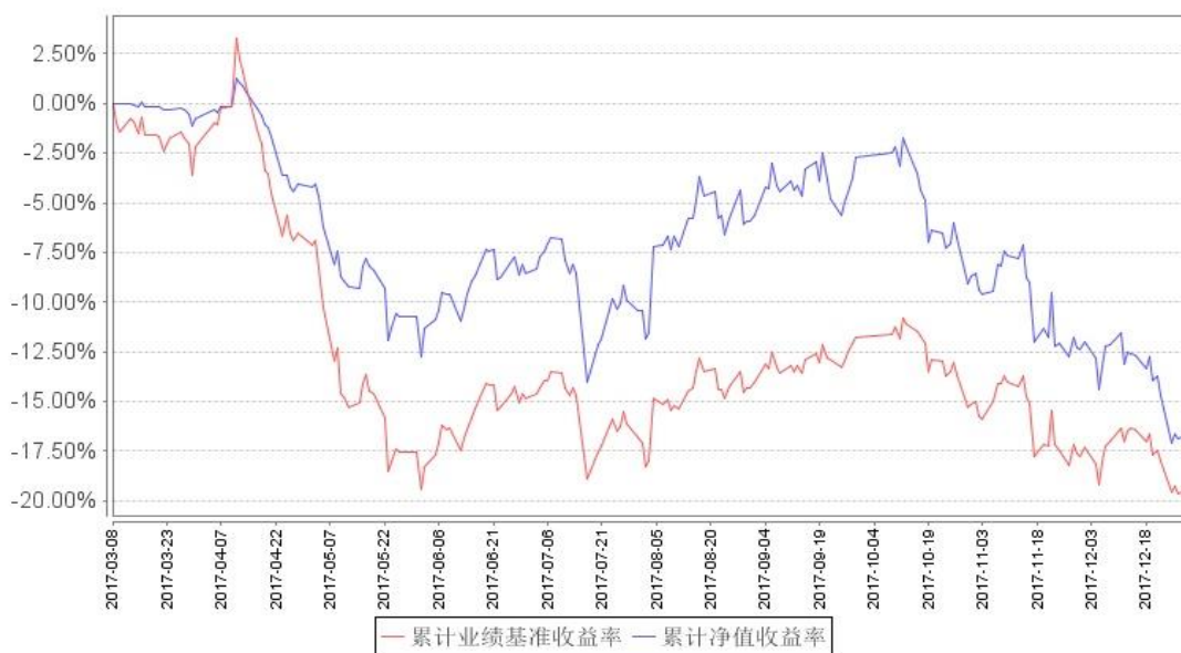
南方军工混合累计净值增长率与同期业绩比较基准收益率的历史走势对比图

注：本基金的基金合同生效日至本报告期末不满 1 年；本基金建仓期为自基金合同生效之日起 6