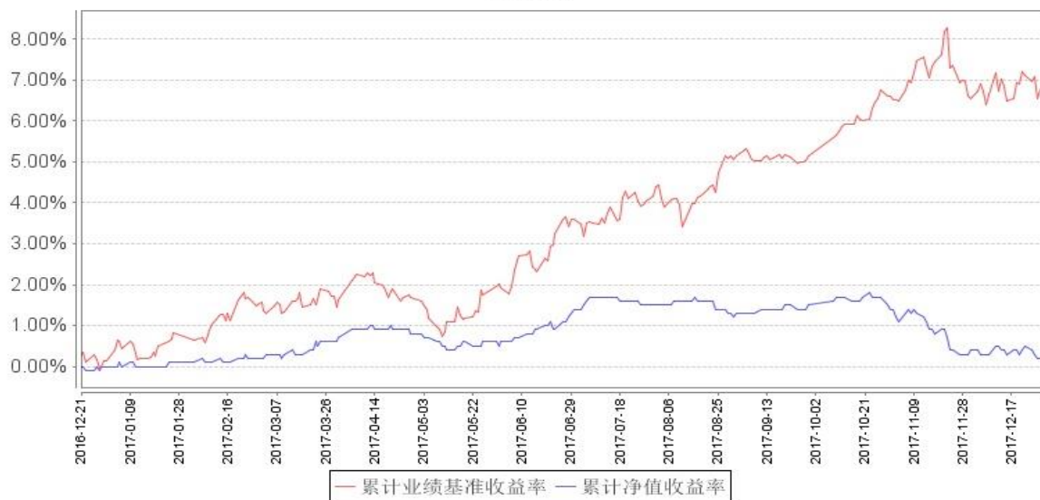
南方睿见定期开放混合发起累计净值增长率与同期业绩比较基准收益率的历史走势对比图

注：本基金建仓期为自基金合同生效之日起 6 个月，建仓结束时各项资产配置比例符合合同约定。