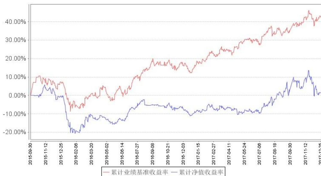
南方香港成长累计净值增长率与同期业绩比较基准收益率的历史走势对比图