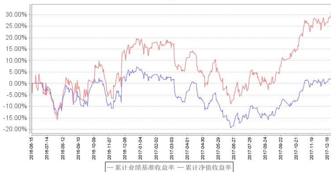
南方原油 (LOF-QDII) 累计净值增长率与同期业绩比较基准收益率的历史走势对比图