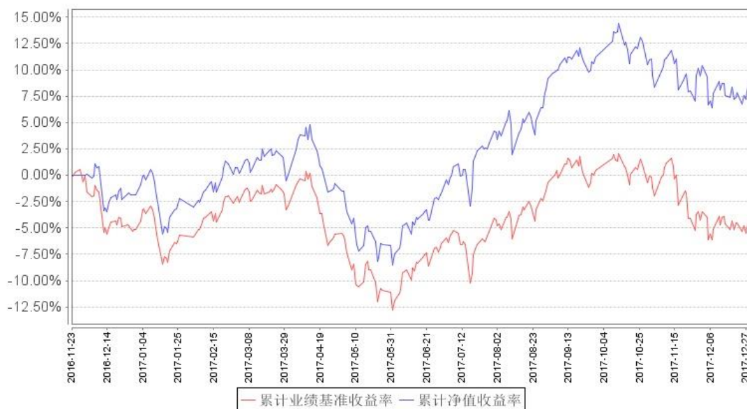
南方中证500增强A累计净值增长率与同期业绩比较基准收益率的历史走势对比图