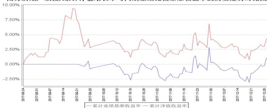
南方房地产联接A累计净值增长率与同期业绩比较基准收益率的历史走势对比图