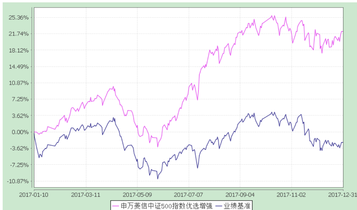
自基金合同生效以来份额累计净值增长率与业绩比较基准收益率的历史走势对比图 (2017 年 1 月 10 日至 2017 年 12 月 31 日)