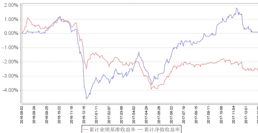
南方荣毅定期开放混合累计净值增长率与同期业绩比较基准收益率的历史走势对比图