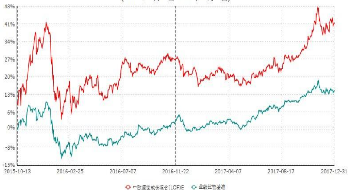
中欧盛世成长混合(LOF)E累计净值增长率与业绩比较基准收益率历史走势对比图 (2015年10月13日-2017年12月31日)

注：本基金于 2015 年 10 月 8 日新增 E 份额，图示日期为 2015 年 10 月 13 日至 2017 年 12 月 31 日。