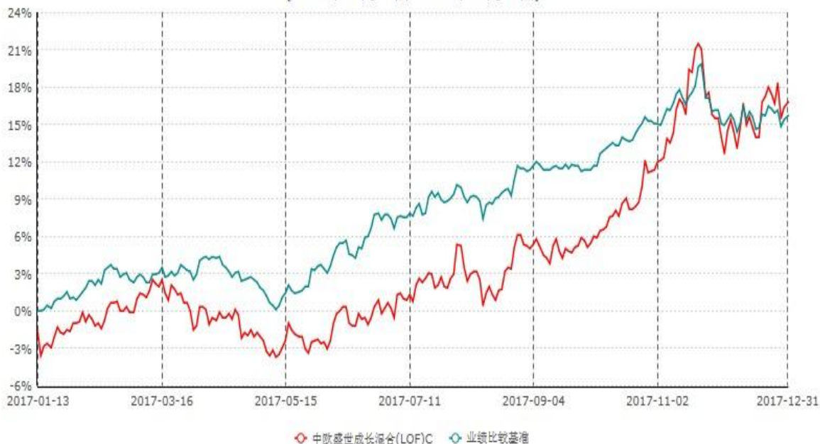
中欧盛世成长混合(LOF)C累计净值增长率与业绩比较基准收益率历史走势对比图 (2017年01月13日-2017年12月31日)

注：本基金于2017年01月12日新增C份额，图示日期为2017年01月13日至2017年12月31日。