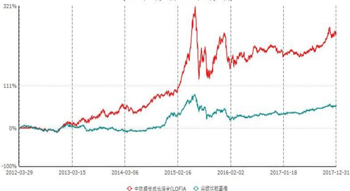
中欧盛世成长混合(LOF)A累计净值增长率与业绩比较基准收益率历史走势对比图 (2012年03月29日-2017年12月31日)