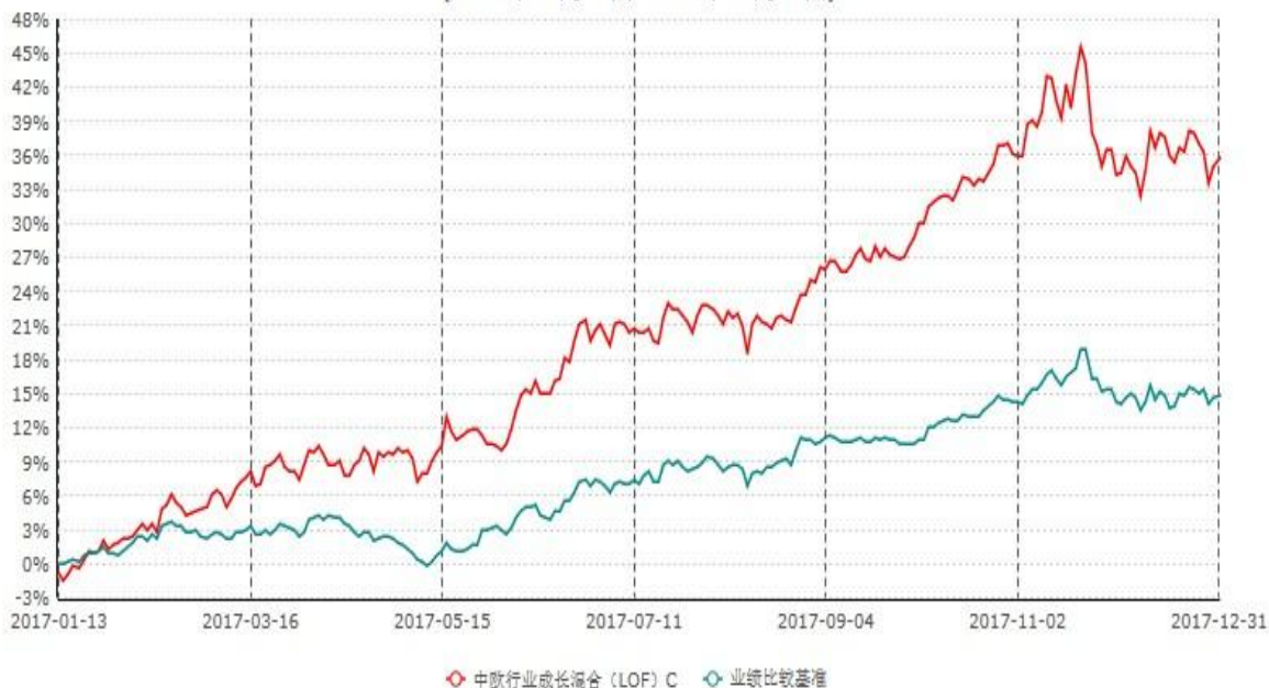
中欧行业成长混合 (LOF) C 累计净值增长率与业绩比较基准收益率历史走势对比图 (2017年01月13日-2017年12月31日)

注：本基金于 2017 年 01 月 12 日新增 C 份额，图示日期为 2017 年 01 月 13 日至 2017 年 12 月 31 日。