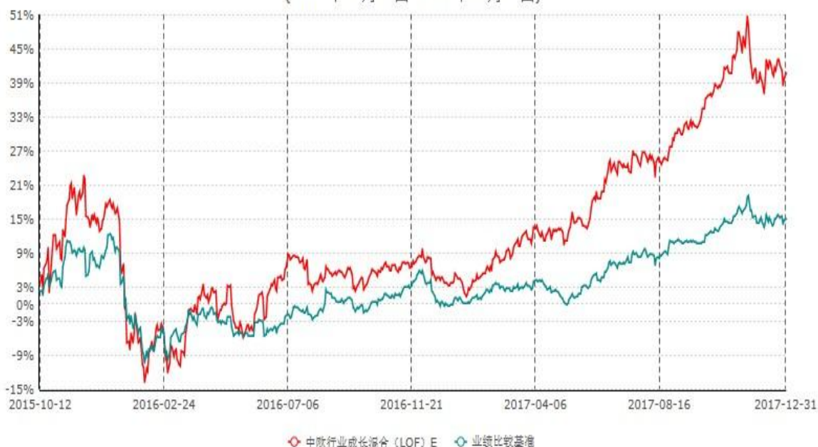
中欧行业成长混合(LOF) E累计净值增长率与业绩比较基准收益率历史走势对比图 (2015年10月12日-2017年12月31日)

注：本基金于2015年10月8日新增E份额，图示日期为2015年10月12日至2017年12月31日。