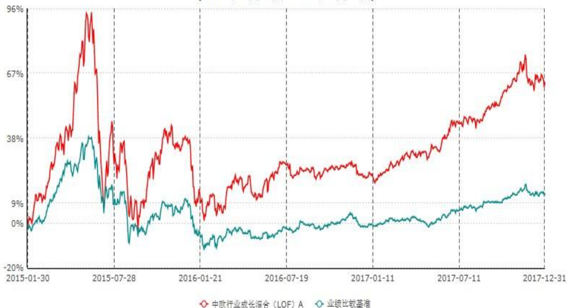
中欧行业成长混合(LOF) A累计净值增长率与业绩比较基准收益率历史走势对比图 (2015年01月30日-2017年12月31日)