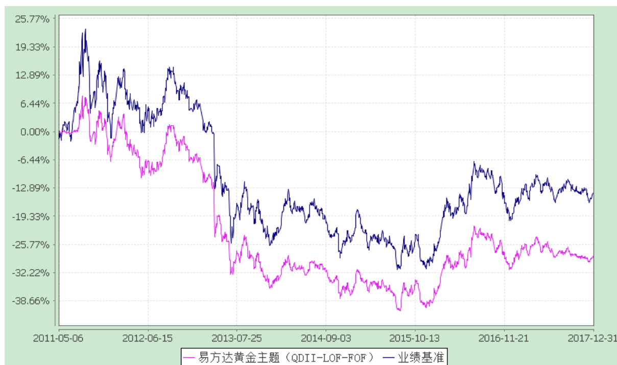
易方达黄金主题证券投资基金（LOF） 份额累计净值增长率与业绩比较基准收益率历史走势对比图 (2011年5月6日至2017年12月31日)