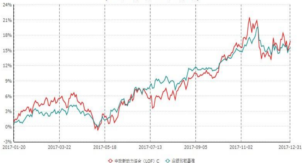
中欧新动力混合（LOF）C累计净值增长率与业绩比较基准收益率历史走势对比图 (2017年01月20日-2017年12月31日)

注：自 2017 年 01 月 19 日起，本基金增加 C 类份额。图示日期为 2017 年 01 月 20 日至 2017 年 12 月 31 日。