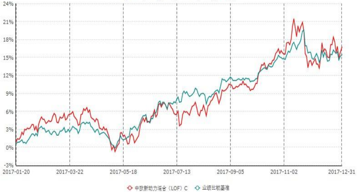
中欧新动力混合(LOF)C累计净值增长率与业绩比较基准收益率历史走势对比图 (2017年01月20日-2017年12月31日)

注：自2017年01月19日起，本基金增加C类份额。图示日期为2017年01月20日至2017年12月31日。