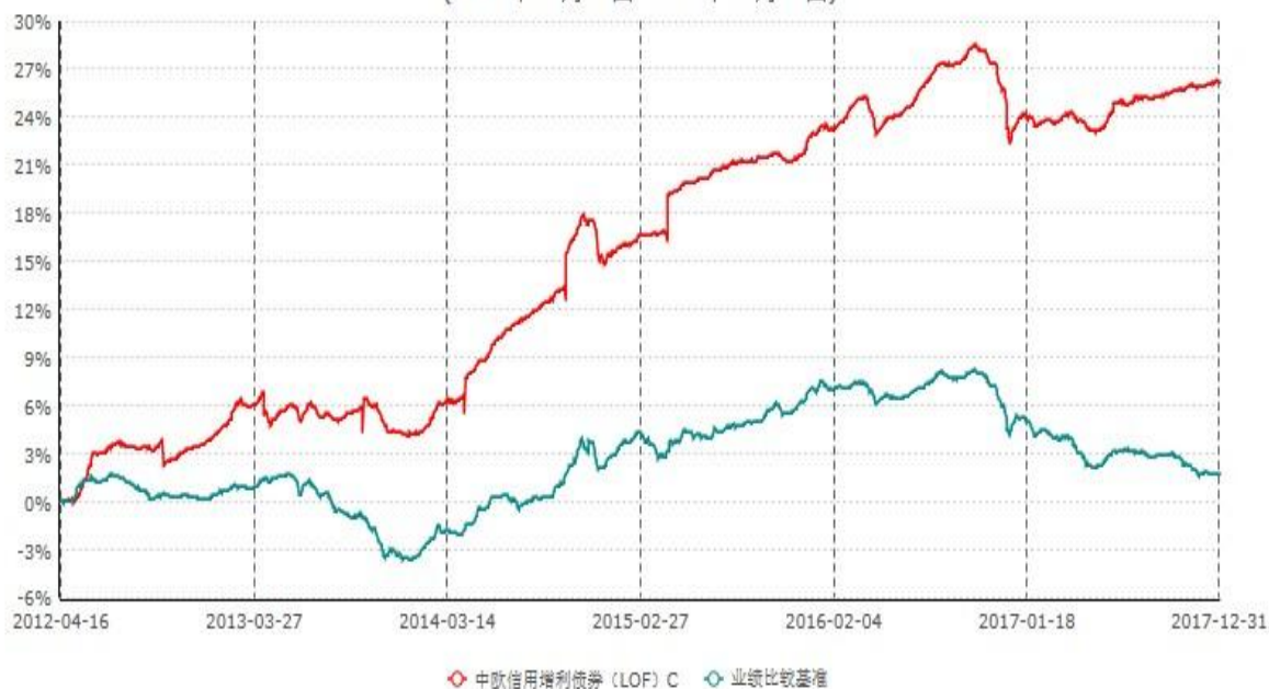
中欧信用增利债券（LOF）C累计净值增长率与业绩比较基准收益率历史走势对比图 (2012年04月16日-2017年12月31日)