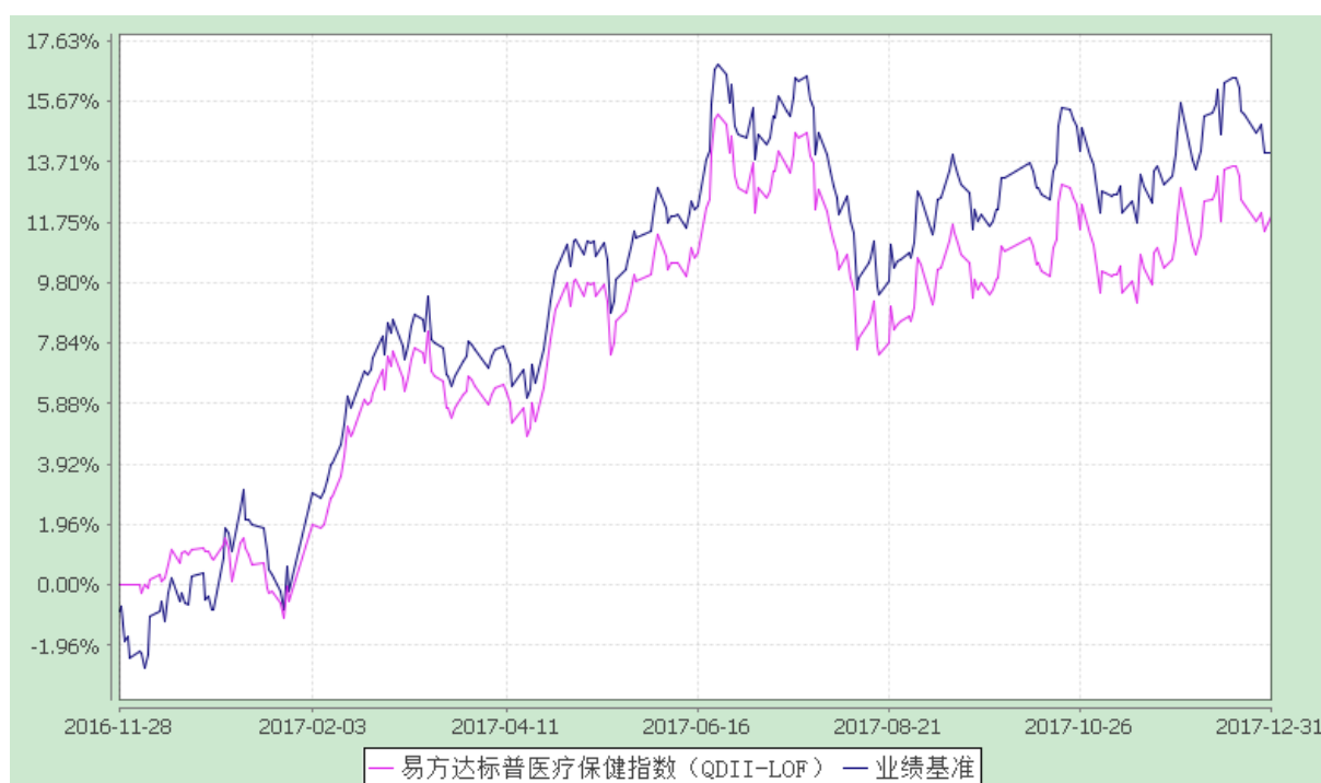
易方达标普医疗保健指数证券投资基金（LOF） 份额累计净值增长率与业绩比较基准收益率历史走势对比图 （2016 年 11 月 28 日至 2017 年 12 月 31 日）