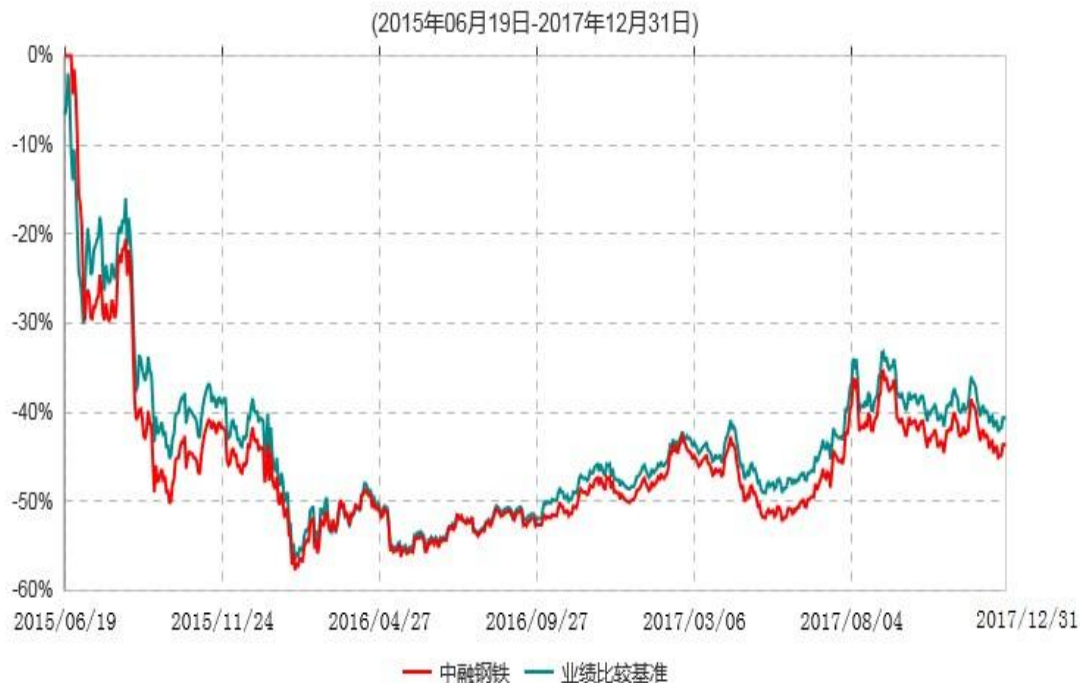
中融国证钢铁行业指数分级证券投资基金累计净值增长率与业绩比较基准收益率历史走势对比图

注：按基金合同和招募说明书的约定，本基金自基金合同生效日起6个月内为建仓期，建仓期结束时本基金的各项投资比例符合基金合同的有关约定。