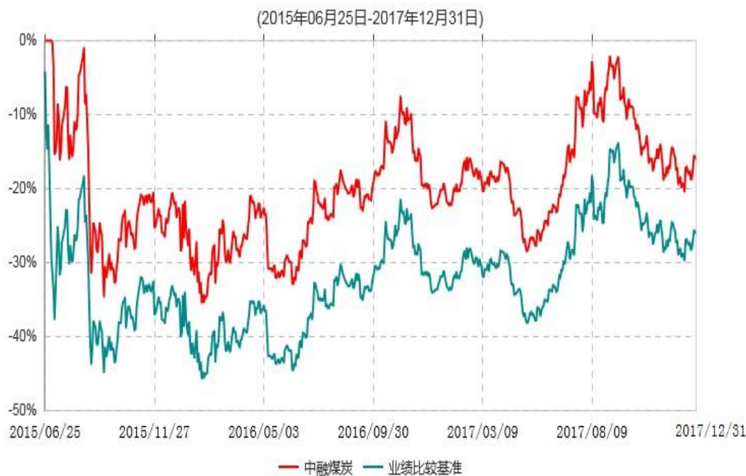
中融中证煤炭指数分级证券投资基金累计净值增长率与业绩比较基准收益率历史走势对比图