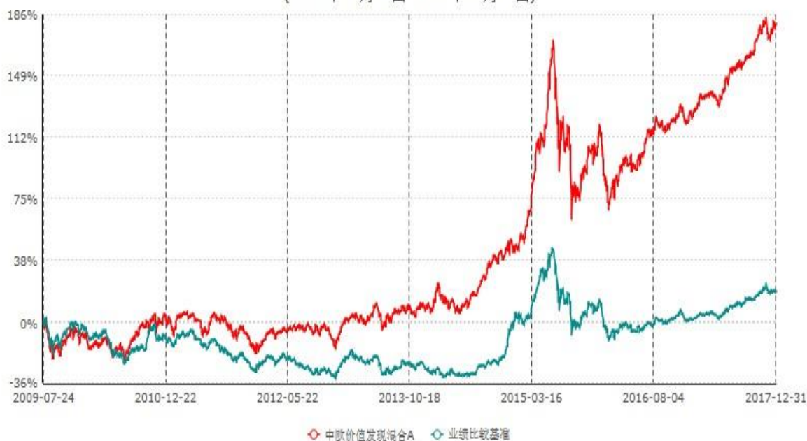
中欧价值发现混合A累计净值增长率与业绩比较基准收益率历史走势对比图 (2009年07月24日-2017年12月31日)