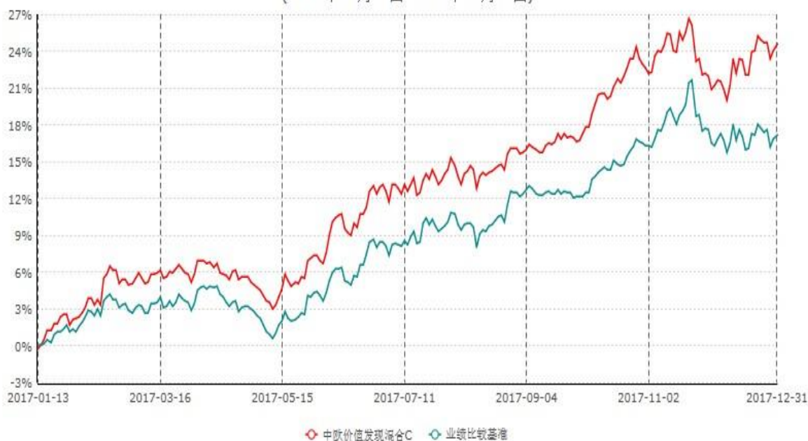
中欧价值发现混合C累计净值增长率与业绩比较基准收益率历史走势对比图 (2017年01月13日-2017年12月31日)

注：自 2017 年 01 月 12 日起，本基金增加 C 类份额。图示日期为 2017 年 01 月 13 日至 2017 年 12 月 31 日。