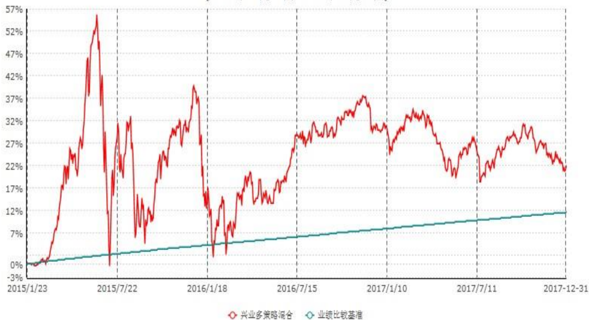
兴业多策略灵活配置混合型发起式证券投资基金累计净值增长率与业绩比较基准收益率历史走势对比图 (2015年01月23日-2017年12月31日)