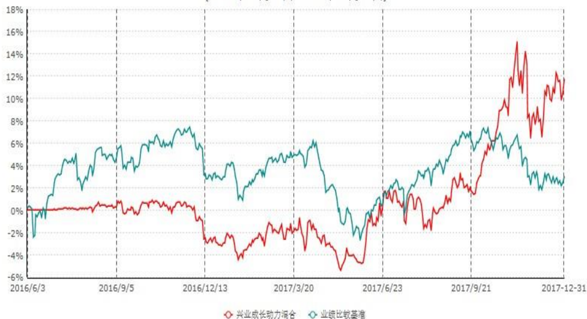
兴业成长动力灵活配置混合型证券投资基金累计净值增长率与业绩比较基准收益率历史走势对比图 (2016年06月03日-2017年12月31日)