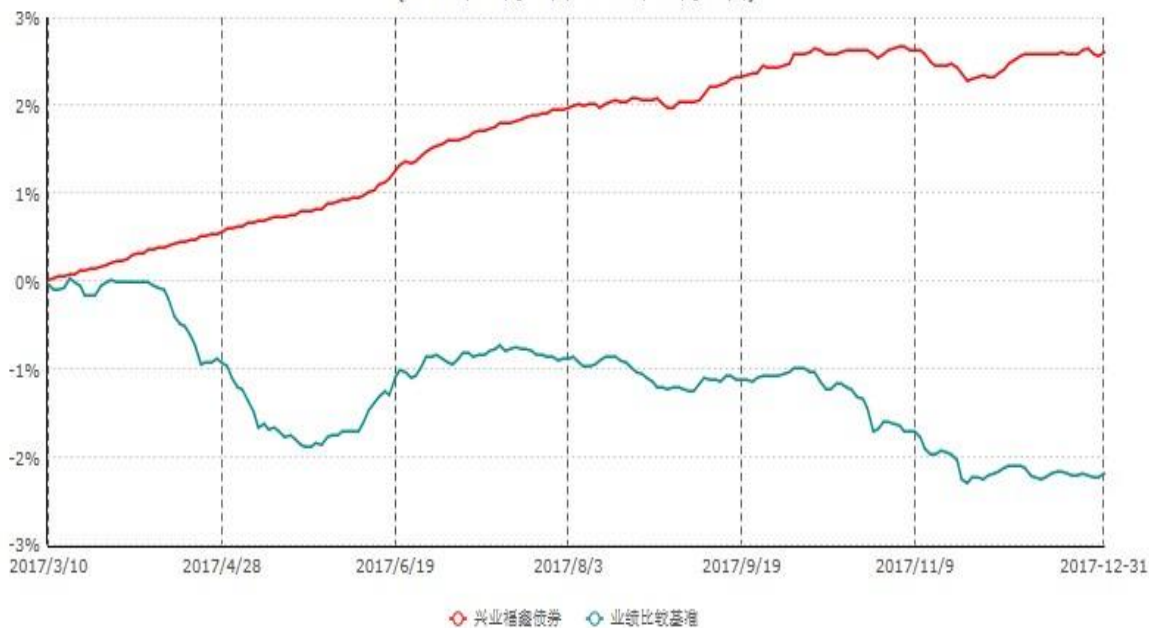
兴业福鑫债券型证券投资基金累计净值增长率与业绩比较基准收益率历史走势对比图 (2017年03月10日-2017年12月31日)