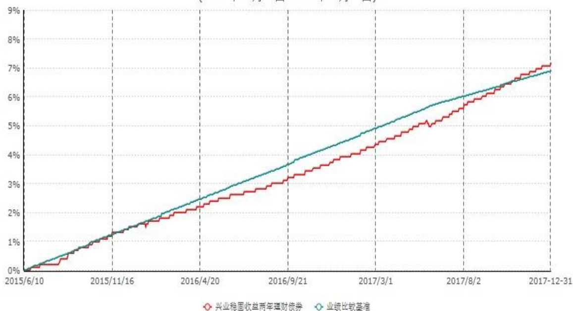
兴业稳固收益两年理财债券型证券投资基金累计净值增长率与业绩比较基准收益率历史走势对比图 (2015年06月10日-2017年12月31日)