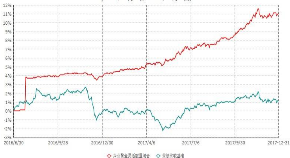
兴业聚全灵活配置混合型证券投资基金累计净值增长率与业绩比较基准收益率历史走势对比图 (2016年06月30日-2017年12月31日)

注：本基金基金合同于2016年6月30日生效，根据本基金基金合同规定，本基金自基金合同生效之日起六个月内已使基金的投资组合比例符合基金合同的约定。