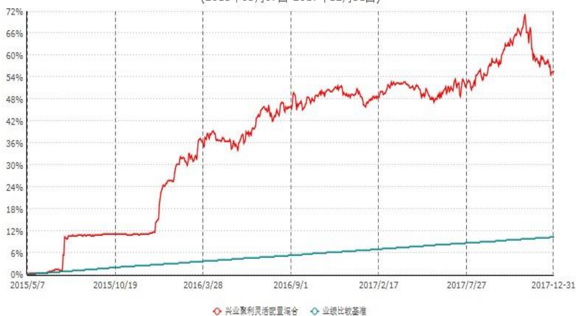
兴业聚利灵活配置混合型证券投资基金累计净值增长率与业绩比较基准收益率历史走势对比图 (2015年05月07日-2017年12月31日)