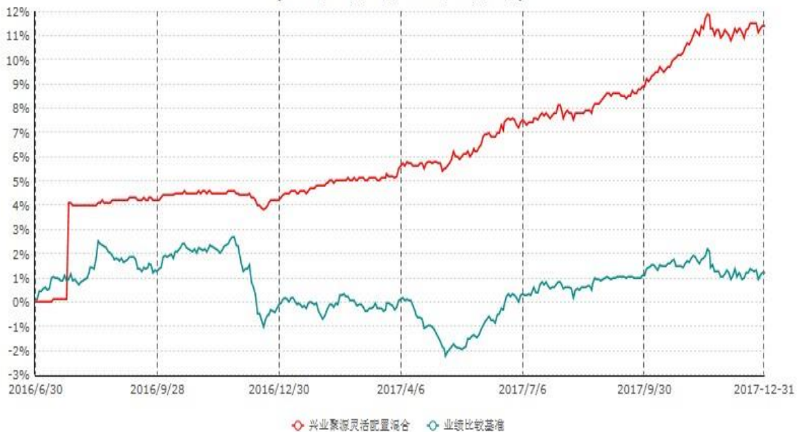
兴业聚源灵活配置混合型证券投资基金累计净值增长率与业绩比较基准收益率历史走势对比图 (2016年06月30日-2017年12月31日)

注：本基金基金合同于2016年6月30日生效，根据本基金基金合同规定，本基金自基金合同生效之日起六个月内已使基金的投资组合比例符合基金合同的约定。