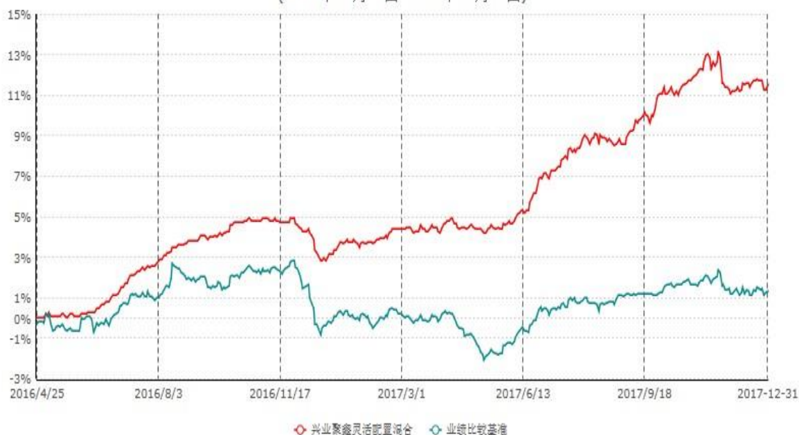
兴业聚鑫灵活配置混合型证券投资基金累计净值增长率与业绩比较基准收益率历史走势对比图 (2016年04月25日-2017年12月31日)