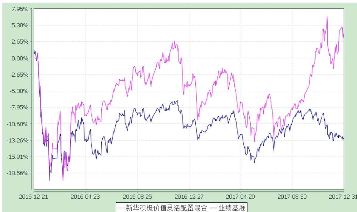
新华积极价值灵活配置混合型证券投资基金 份额累计净值增长率与业绩比较基准收益率的历史走势对比图 (2015 年 12 月 21 日至 2017 年 12 月 31 日)