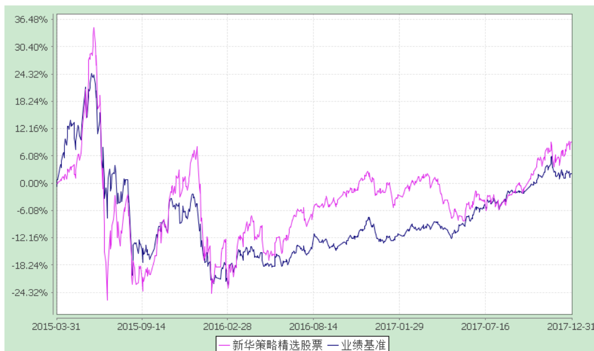
份额累计净值增长率与业绩比较基准收益率的历史走势对比图 (2015 年 3 月 31 日至 2017 年 12 月 31 日)