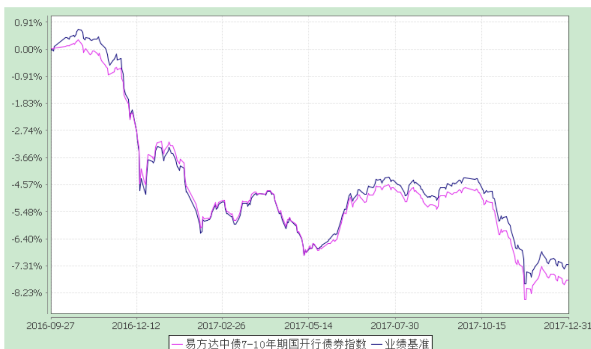
易方达中债 7-10 年期国开行债券指数证券投资基金 份额累计净值增长率与业绩比较基准收益率历史走势对比图 (2016 年 9 月 27 日至 2017 年 12 月 31 日)

注：1.按基金合同和招募说明书的约定，本基金的建仓期为六个月，由于规模变动，建仓期结束标的指数成份券、备选成份券占基金非现金资产比例被动超标，本基金已在法规规定的期限内调整完毕。建仓期结束时其他各项资产配置比例符合本基金合同（第十二部分二、投资范围，三、投资策略和四、投资限制）的有关约定。