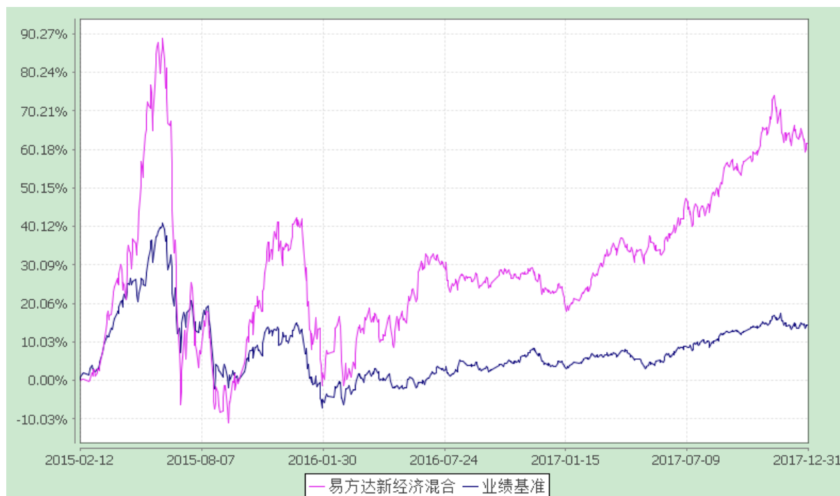
易方达新经济灵活配置混合型证券投资基金 份额累计净值增长率与业绩比较基准收益率历史走势对比图 (2015年2月12日至2017年12月31日)

注：自基金合同生效至报告期末，基金份额净值增长率为 61.70%，同期业绩比较基准收益率为 14.45%。