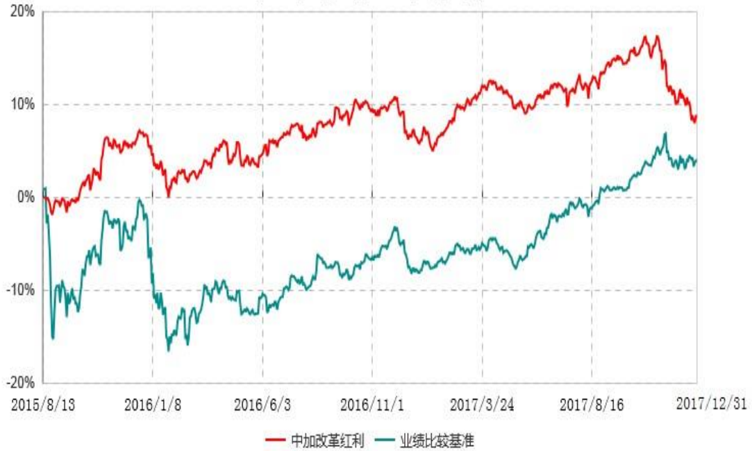
中加改革红利灵活配置混合型证券投资基金累计净值增长率与业绩比较基准收益率历史走势对比图 (2015年08月13日-2017年12月31日)