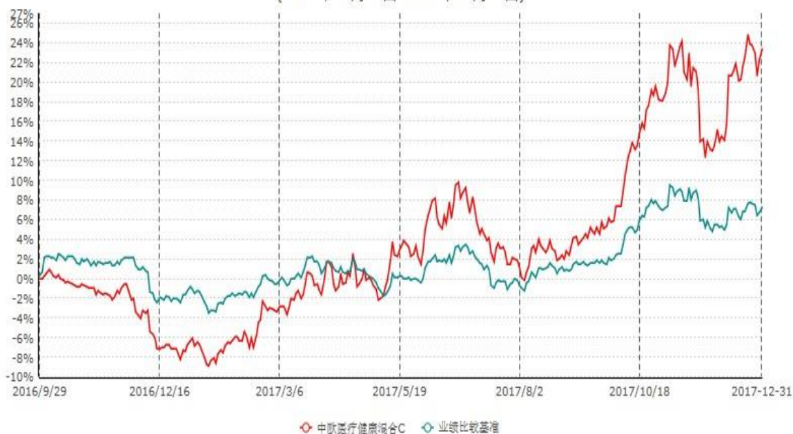
中欧医疗健康混合C累计净值增长率与业绩比较基准收益率历史走势对比图 (2016年09月29日-2017年12月31日)

注：本基金基金合同生效日期为 2016 年 9 月 29 日，按基金合同的规定，本基金自基金合同生效起六个月为建仓期，建仓期结束时本基金的各项资产配置比例已达到基金合同的规定