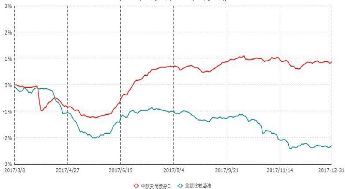
中欧天尚债券C累计净值增长率与业绩比较基准收益率历史走势对比图 (2017年03月08日-2017年12月31日)

注：本基金基金合同生效日期为 2017 年 3 月 8 日，自基金合同生效日起到本报告期末不满一年，按基金合同的规定，本基金自基金合同生效起六个月为建仓期，建仓期结束时本基金的各项资产配置比例已达到基金合同的规定