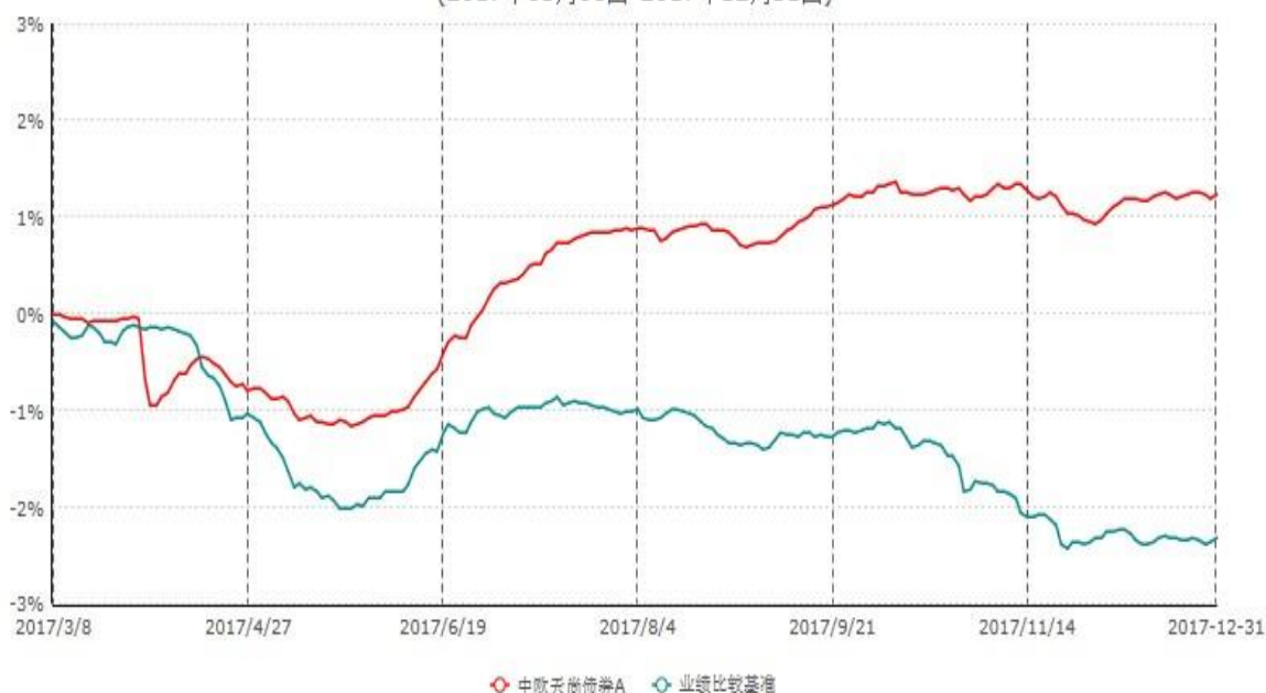
中欧天尚债券A累计净值增长率与业绩比较基准收益率历史走势对比图 (2017年03月08日-2017年12月31日)

注：本基金基金合同生效日期为 2017 年 3 月 8 日，自基金合同生效日起到本报告期末不满一年，按基金合同的规定，本基金自基金合同生效起六个月为建仓期，建仓期结束时本基金的各项资产配置比例已达到基金合同的规定