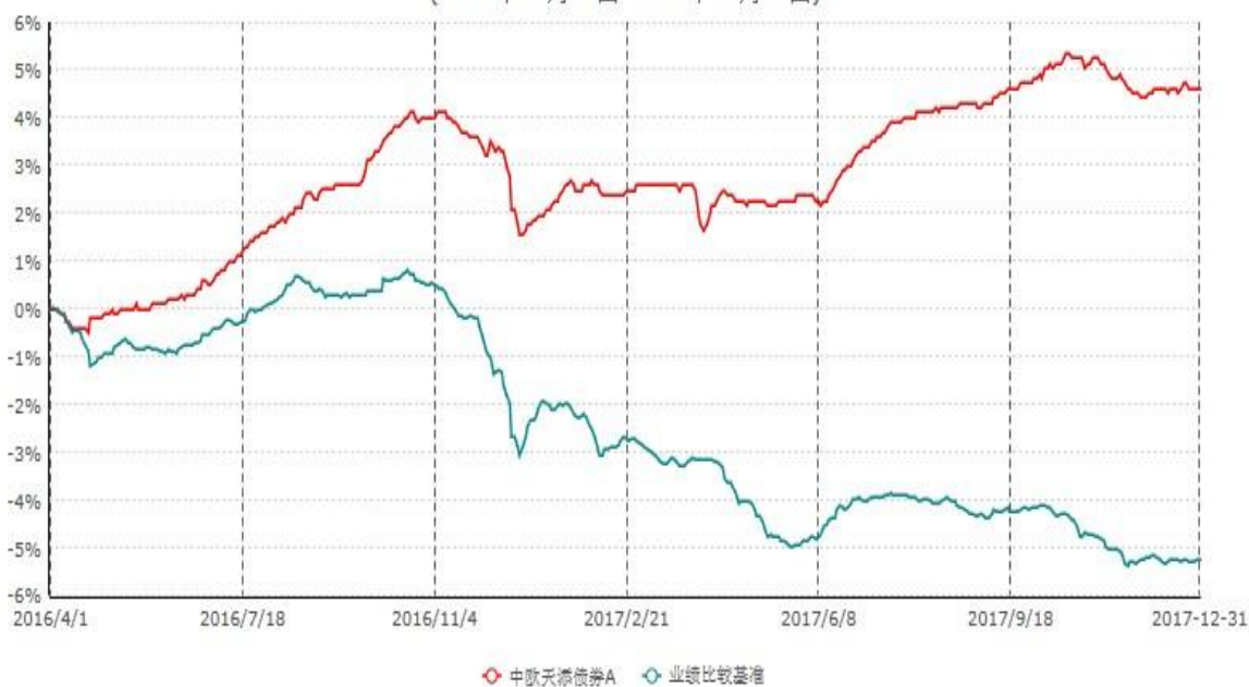
中欧天添债券A累计净值增长率与业绩比较基准收益率历史走势对比图 (2016年04月01日-2017年12月31日)