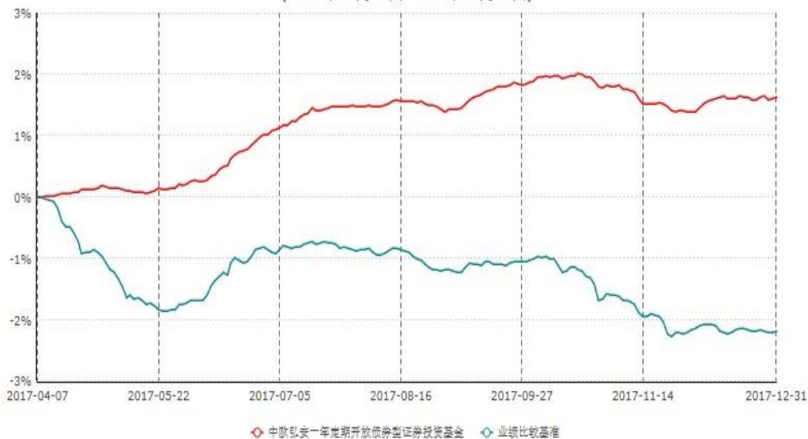
中欧弘安一年定期开放债券型证券投资基金累计净值增长率与业绩比较基准收益率历史走势对比图 (2017年04月07日-2017年12月31日)

注：本基金基金合同生效日期为2017年4月7日，自基金合同生效日起到本报告期末不满一年，按基金合同的规定，本基金自基金合同生效起六个月为建仓期，建仓期结束时本基金的各项资产配置比例已达到基金合同的规定