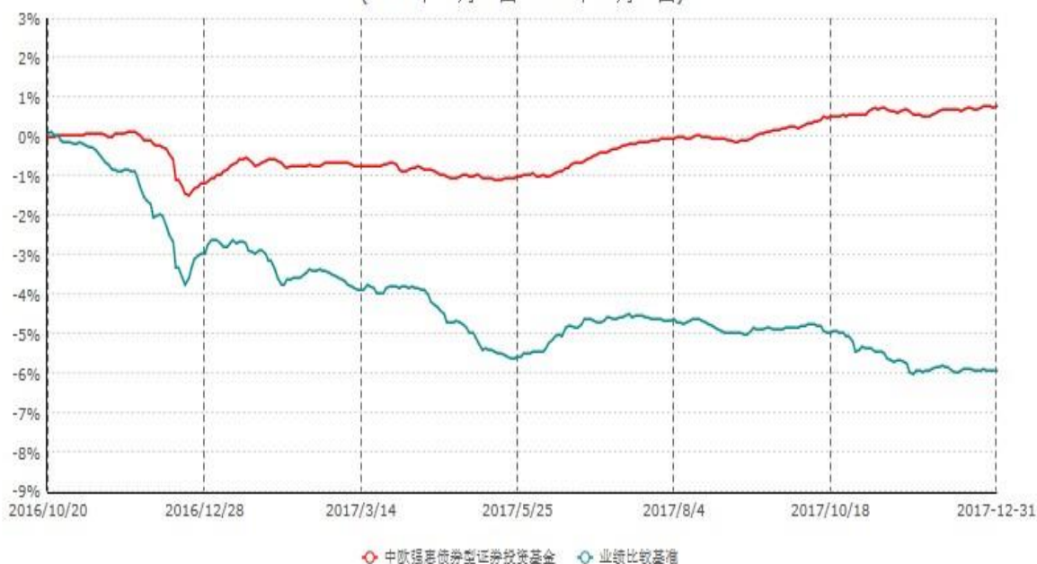
中欧强惠债券型证券投资基金累计净值增长率与业绩比较基准收益率历史走势对比图 (2016年10月20日-2017年12月31日)

注：本基金基金合同生效日期为2016年10月20日，按基金合同的规定，本基金自基金合同生效起六个月为建仓期，建仓期结束时本基金的各项资产配置比例已达到基金合同的规定