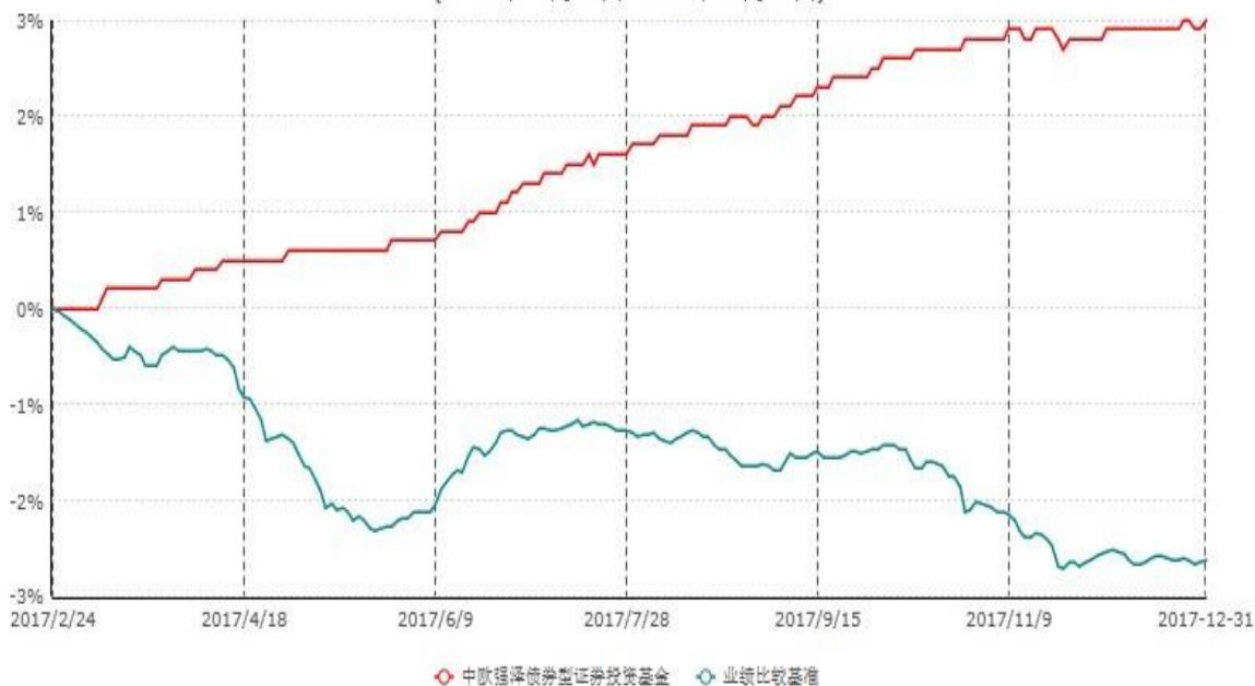
中欧强泽债券型证券投资基金累计净值增长率与业绩比较基准收益率历史走势对比图 (2017年02月24日-2017年12月31日)

注：本基金基金合同生效日期为2017年2月24日，自基金合同生效日起到本报告期末不满一年，按基金合同的规定，本基金自基金合同生效起六个月为建仓期，建仓期结束时本基金的各项资产配置比例已达到基金合同的规定。